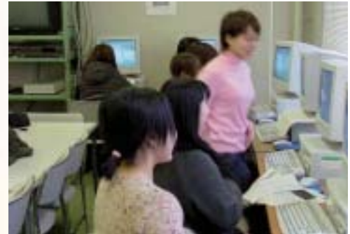
◆自主学習室でレポート作成

総合情報処理センターのサテライト端末が10台利用できる他、ビデオの視聴もできます。また、グループ学習ができるよう、中央にテーブルが用意されています(最大15人程度)。常時開放し、学生も記名するだけでいつでも利用できます。