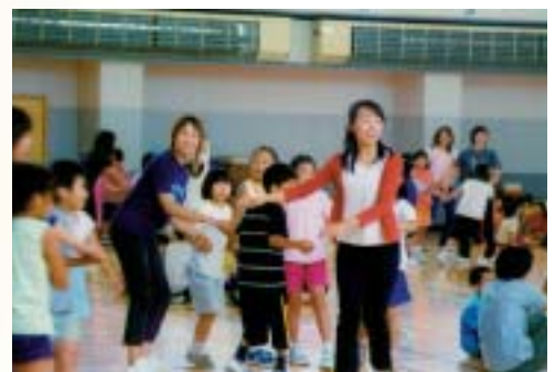
◆フレンドシップ事業による「ふれあい体験活動」

児童生徒をとりまく学校内外の教育環境および社会環境に関する研究と支援 学校教育と学校外教育の境界領域の研究と指導 教育をめぐる人間関係の研究と支援