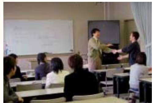
◆構成的エンカウンターの指導風景

心理臨床・教育相談 地域の適応指導教室と連携した教育臨床の実践と研究 心理臨床・教育相談・教育臨床従事者の育成