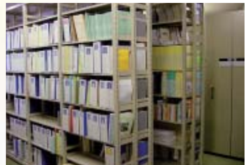
◆資料室の研究資料

全国の教員養成系大学・学部や附属学校から収集した教育実践資料、ビデオライブラリなど、さまざまな研究資料を整理しています。