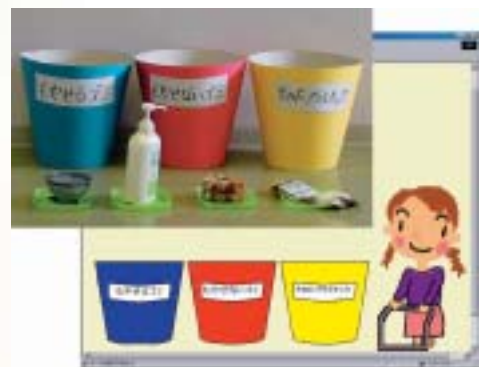
◆身体動作で学習するWeb教材

情報システムや遠隔教育システムの研究と開発 情報教育教材の開発方法の研究と指導 情報教育、遠隔教育など、新領域のカリキュラム開発 障害児などの情報弱者の学習を支援する基盤技術の開発