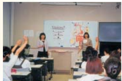
◆マイクロティーチング室での模擬授業

模擬授業を収録し、それを再生しながら教授方法を指導するマイクロティーチングが展開できるように設計されています。その他、小規模の研究会や講演会、ミニスタジオなど、多目的に利用できます(定員60名)。