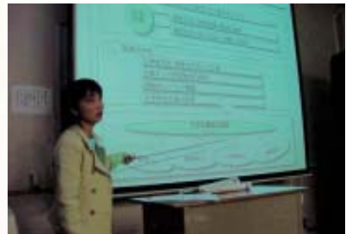
◆センター研究員による発表会

教科教育における指導と評価の研究と指導 学級経営や特別活動など教科外教育の研究と指導 国際理解、福祉、地域理解など、新領域のカリキュラム開発 教育実習の内容や方法の研究