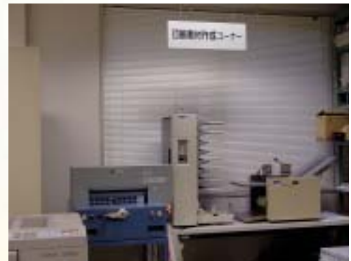
◆教材作成室の印刷教材作成コーナー

さまざまな教材を開発できるように、印刷機、カラーコピー機、丁合機、紙折機、裁断機、ビデオ編集機、ビデオダビング装置、パソコンなど、最新の機材がそろっています。学部・附属教官、センター研究員の他、学外の教育関係者にも利用の便を図っています。学生は担当教官の指導の下に利用できます。また、学部サーバは、教育学部の情報発信の拠点となっています。