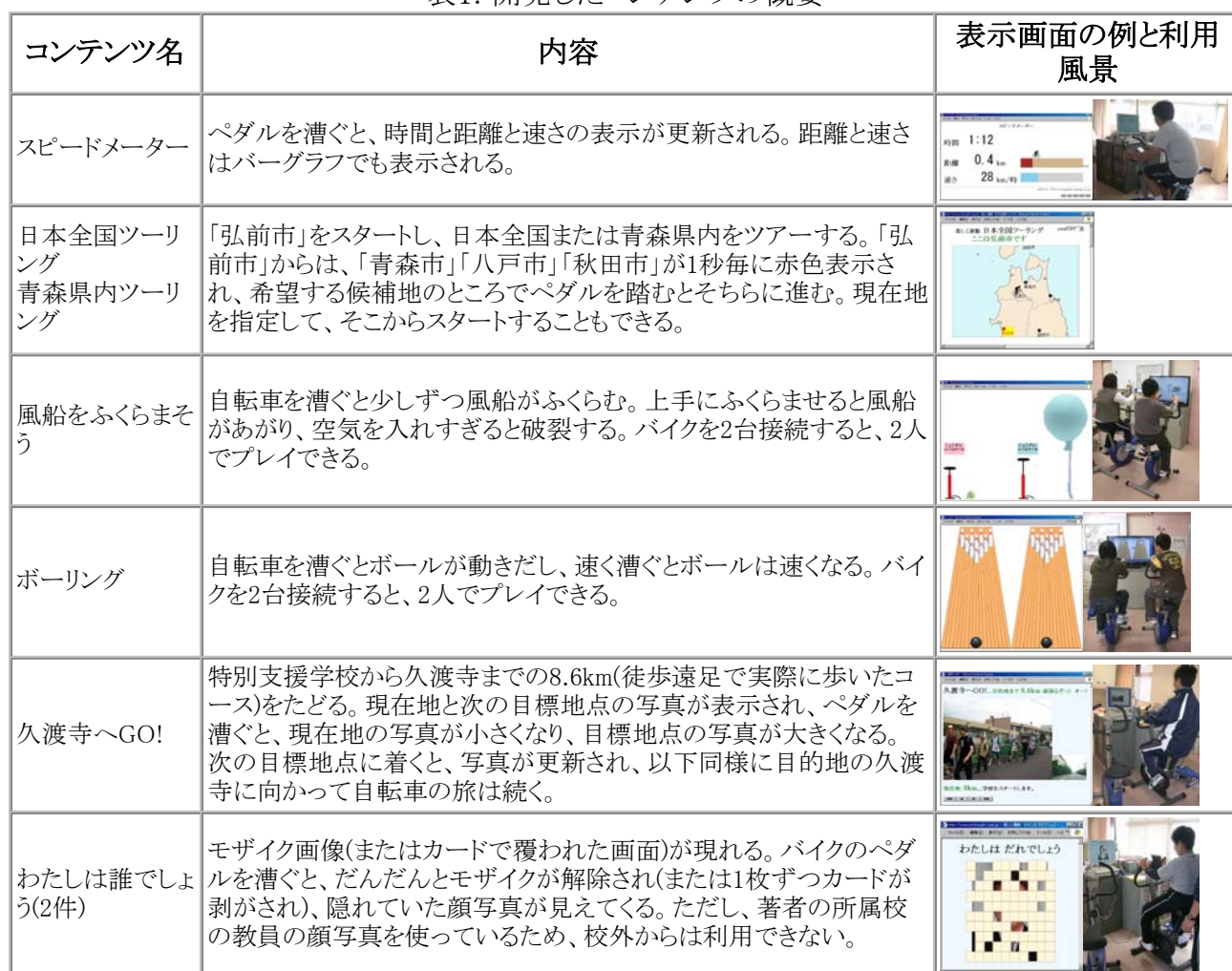
表1: 開発したコンテンツの概要